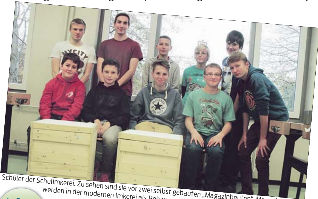
Schüler der Schulimkerei. Zu sehen sind sie vor zwei selbst gebauten „Magazinbeuten“. Magazinbeuten werden in der modernen Imkerei als Behausung (Beute) von Honigbienen verwendet.

... die Einrichtung einer Schulimkerei an der Gesamtschule „Wilhelm Weitling“ in Olvenstedt. In der siebten Klassenstufe können sich die Schüler im praxisorientierten Lernen einem Wahlthema widmen. Wir haben die Imkerei angeboten und 15 Schüler dafür gewonnen. Mit den Schülern haben wir bisher die Honigbiene und andere Insektenarten, deren Lebensweisen, Gefährdungen und mögliche Schutzmaßnahmen kennen gelernt. Wir haben uns auf die Honigbiene konzentriert und das fleißige Insekt bei einer Exkursion näher kennengelernt. Seitdem bauen wir an zwei