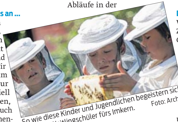
So wie diese Kinder und Jugendlichen begeistern sich auch die Weitlingschüler fürs Imkern.